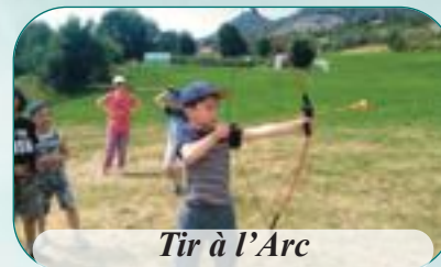
Tir à l'Arc