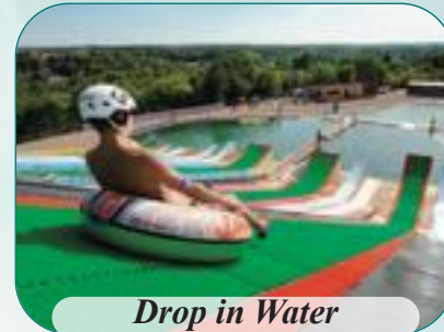
Drop in Water