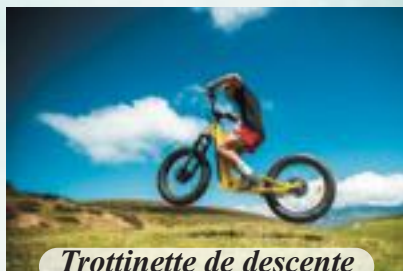
Trottinette de descente

Toutes les prestations sportives extérieures sont encadrées par des Moniteurs Fédéraux et / ou Brevetés d'État.