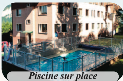
Piscine sur place

Sur la commune de Bellevaux à 24 km au sud des rives du lac Léman entre Thonon-les-Bains et Genève. Exposition Est sur le plateau d'Hirmentaz, face à la chaîne des Alpes du Léman. Une grande maison moderne et confortable qui dispose de nombreux atouts. Chambres de 4 à 8 lits avec salle d'eau, salles d'activités, salle à manger, grande terrasse, beaux espaces d'évolution autour du chalet et cerise sur le gâteau : la piscine sur le centre.