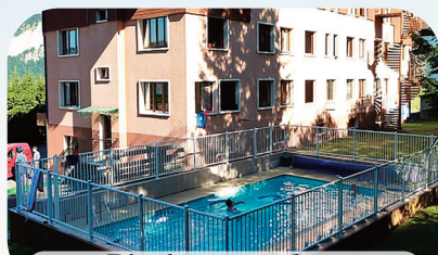
Piscine sur place

Sur la commune de Bellevaux à 24 km au sud des rives du lac Léman entre Thonon-Bains et Genève. Exposition Est sur le plateau d'Hirmontaz, face à la chaîne des Alpes du Léman. Une grande maison moderne et confortable qui dispose de nombreux atouts. Chambres de 4 à 8 lits avec salle d'eau, salles d'activités, salle à manger, grande terrasse, beaux espaces d'évolution autour du chalet et cerise sur le gâteau : la piscine sur le centre.